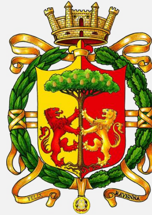
Comune di Ravenna